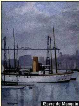
Œuvre de Manguin