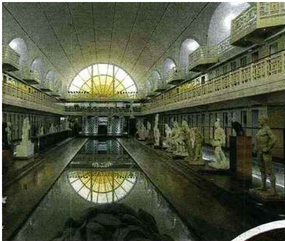
Les collections du Musée d'art et d'industrie de Roubaix ont pris place dans une ancienne piscine Art déco.