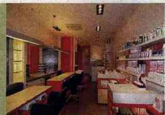
MANUCURIST 4, rue de Castellane (VIII e ). Tél. : 01 42 65 19 30. Manucure Permanent Lac : 70 €. Pose du vernis sans manucure : 50 €.

frais et colorés tenant plus du rendez-vous de copines, le propose à ses clientes. La palette ne compte qu'une quinzaine de coloris mais les basiques y sont (du nacré au bordeaux en passant par le rouge cerise). Le processus est celui d'une manucure classique sauf que l'on polit le dessus de l'ongle pour une meilleure adhésion. Le séchage se fait sous UV. En deux minutes, l'unique couche recouverte d'un top-coat est sèche. Attention : pour le retirer, il faut limer légèrement le dessus de l'ongle et plonger ses doigts dans un liquide à base d'acétone. ■