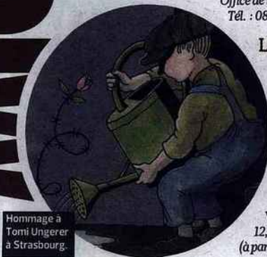
Hommage à Tomi Ungerer à Strasbourg.

12, rue du Dragon. Tél. : 03 88 35 79 80 (à partir de 79 €).